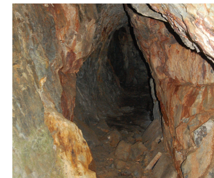
Вхід до печери Довбуша

Стежка промаркована. На маршруті встановлені малі архітектурні форми, облаштовані місця відпочинку.