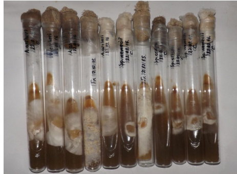
Чисті культури аборигенних видів макроміцетів НПП «Гуцульщина»

фонду. Розгляду передусім потребують такі положення: збільшення чисельності різноманіття макроміцетів у колекції з акцентом на рідкісні види й ті, що перебувають під загрозою зникнення, види з корисними ресурсними властивостями (лікувальні); розширення штамового різноманіття видів, уже представлених у колекції.