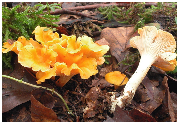
Cantharellus friesii дуже подібна до Лисички звичайної, відрізняється меншими